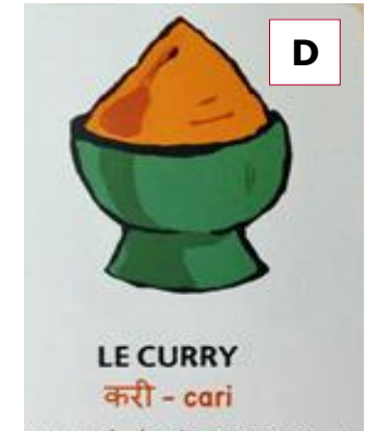
D LE CURRY करी - cari

Les mots autour du monde. Marie-P. Oddoux, éd. Rue des enfants, 2012