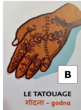
B LE TATOUAGE गोदना - godna